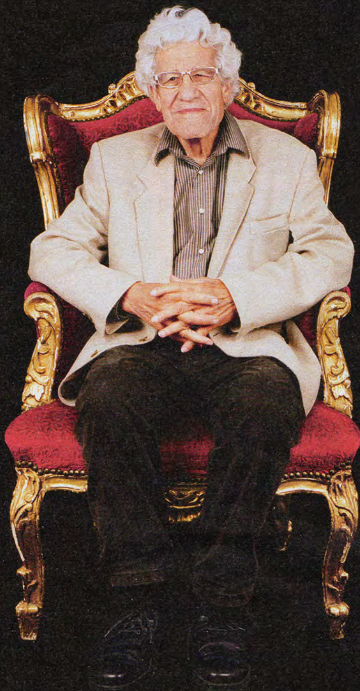
↑ HANS-PETER DÜRR

La mitad de los 200 millones de 'intocables' – dalits– de la India son mujeres, el 16 por ciento de toda la población. Para sus compatriotas son, dicho crudamente, lo más bajo de lo más bajo, hasta el punto de que muchas niñas son vendidas como esclavas para saldar deudas familiares. Manorama es, desde finales de los setenta, la gran portavoz de todas ellas. Es la fundadora de La Voz de las Mujeres y de la Federación Nacional de Mujeres Dalit, organizaciones claves en los avances sociales y la movilización femenina en el subcontinente. Recibió el Right Livelihood Award en 2006.